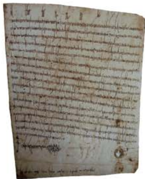
Diplôme du roi Childebert III (683-711)