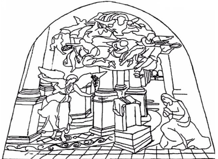
Dessin : J-M Vasseur

Retrouvez les personnages représentés à l'aide des indices et compléter le tableau en indiquant son numéro correspondant sur le plan :